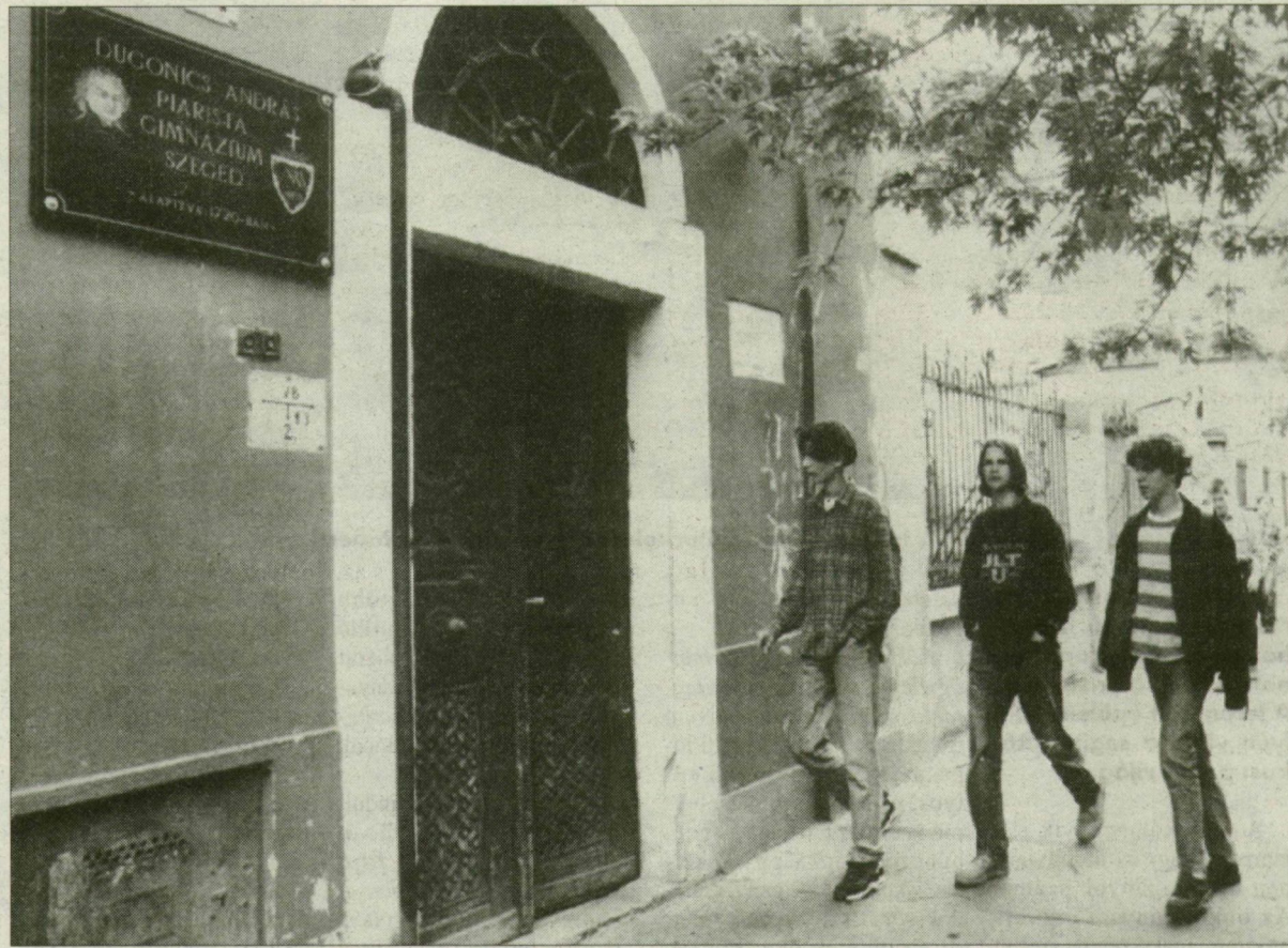
Idő kell hozzá, míg az 1991-ben alakult piarista gimnázium eléri nagy elődje szintjét.

275 évvel ezelőtt telepedtek le és nyitották meg népiskolájukat Szegeden a piaristák, ami akkor a török hódoltság alól felszabadult ország résznek valóságos áldás volt. A tanító rend iskolalapítási évfordulójáról a hét végén Szeged városa is megemlékezik.