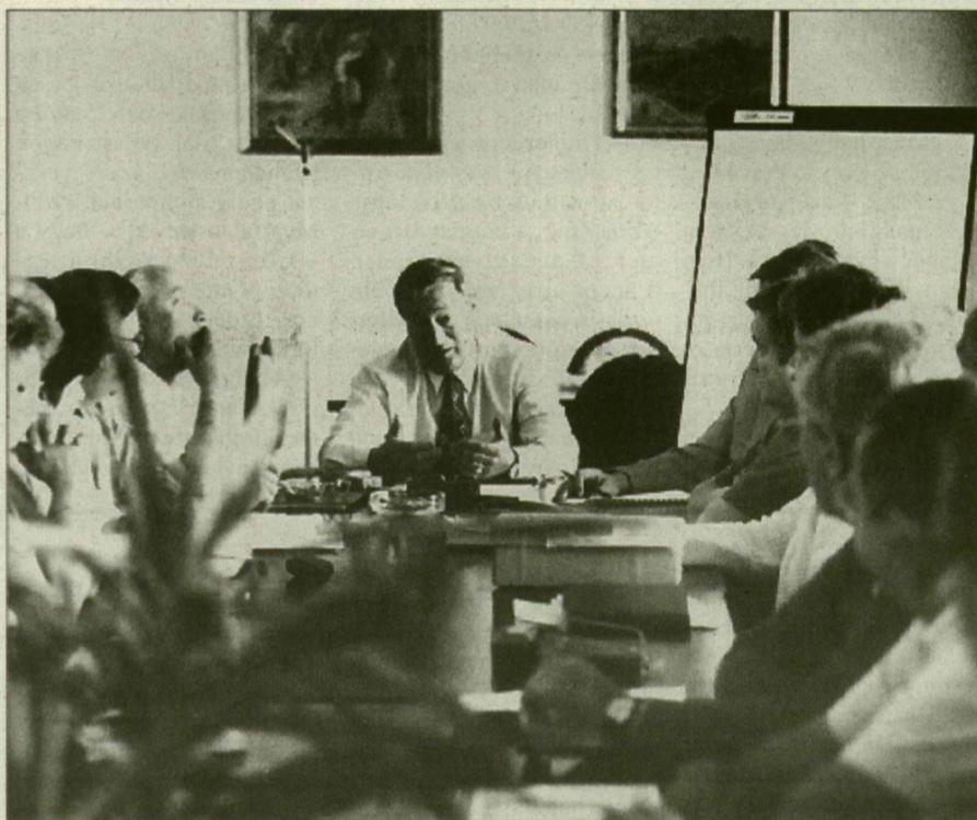
Miénk a gyár. Értekeznek a tulajdonosok