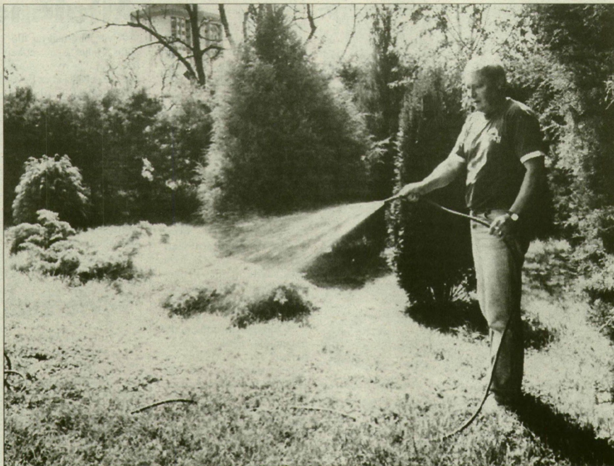
Májusi locsolás aranyat ér.