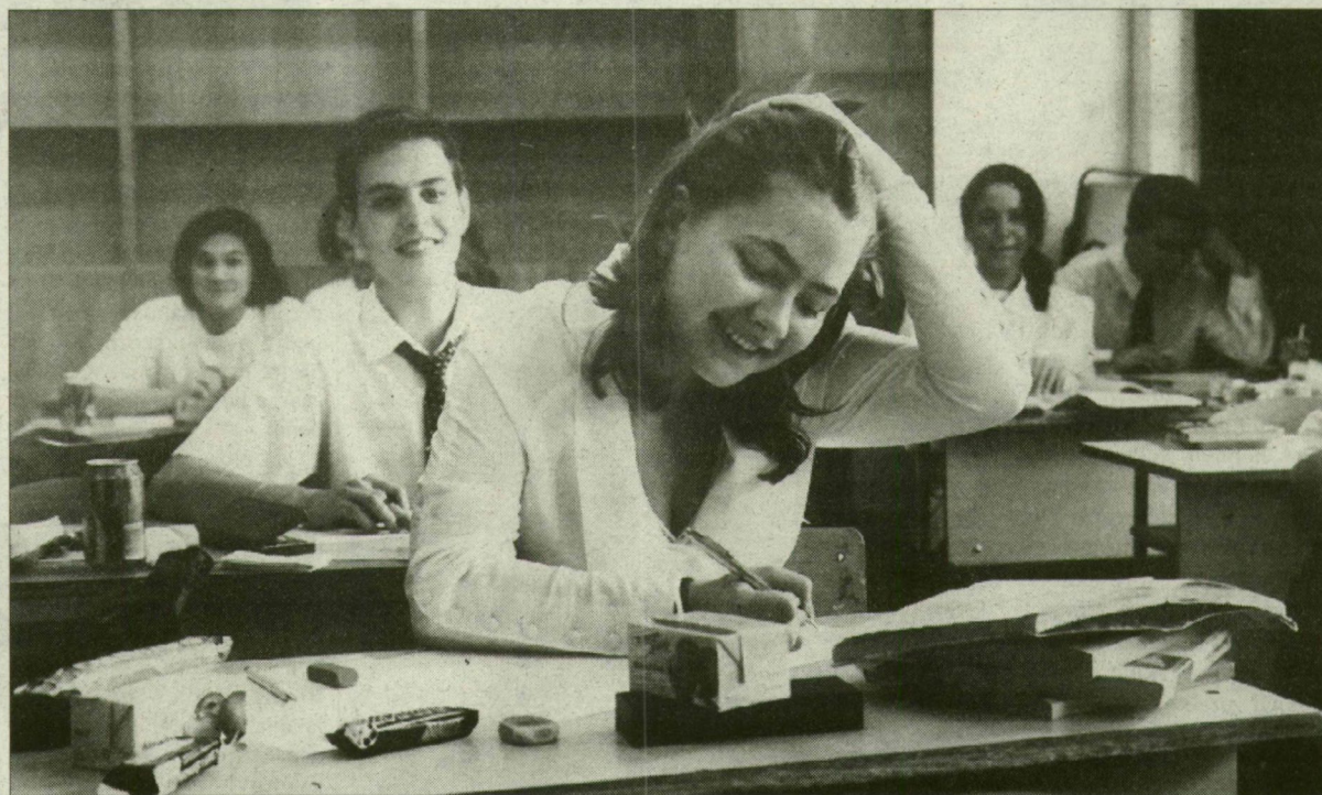
Küzdöttek és bíztak.