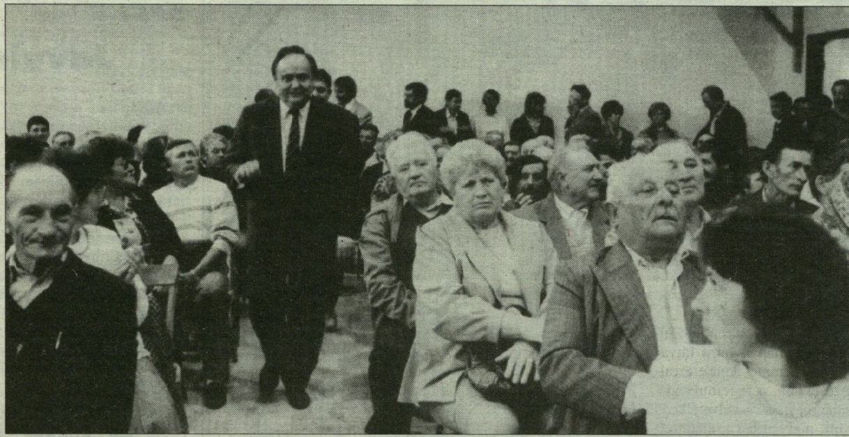
A hallgatóság sorai közt vonult be dr. Torgyán József pártelnök és népes kísérete a szónoki emelvényig.

A Polgármester-szövetség által kezdeményezett ellenzéki fórumozott harmadik rendezvényén, Tömörkény köztség tornatermében szombat este dr. Torgyán József, az FKGP elnöke, miniszterelnökjelölt telt ház előtt fejtette ki politikai programját, élesen bírálta a Horn- és az Antall-kormány politikáját.