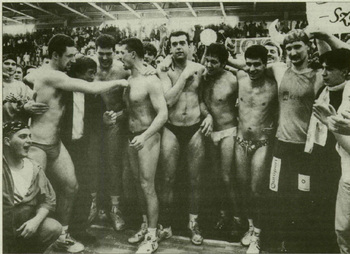
Ha rajtuk múltott volna, még az alsónadrágjuktól is megfosztják kedvenceiket a szurkolók...