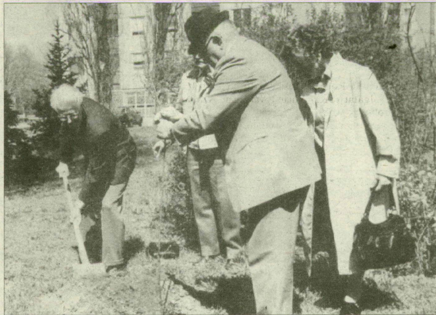
Ritka, de kedves vendég Csongrádon a svéd nagykövet.

Az istentisztelet után, a presbiterek gyűlésén szóba került az is, hogy miként tudnák megvásárolni azt a házat, mely egykor a református egyházé volt, az elmúlt években pedig a polgármester lakott benne, de az önkormányzat értékesíteni akarja. A svéd nagykövet, akit előző látogatásakor (1994. október 31-én, a reformáció évfordulóján) tiszteletbeli presbiterré választottak, megígérte hogy segítségére lesz a gyülekezetnek, hogy eme elhatározásukat siker koronázhassa. Úgy gondolja, hogy a svédországban