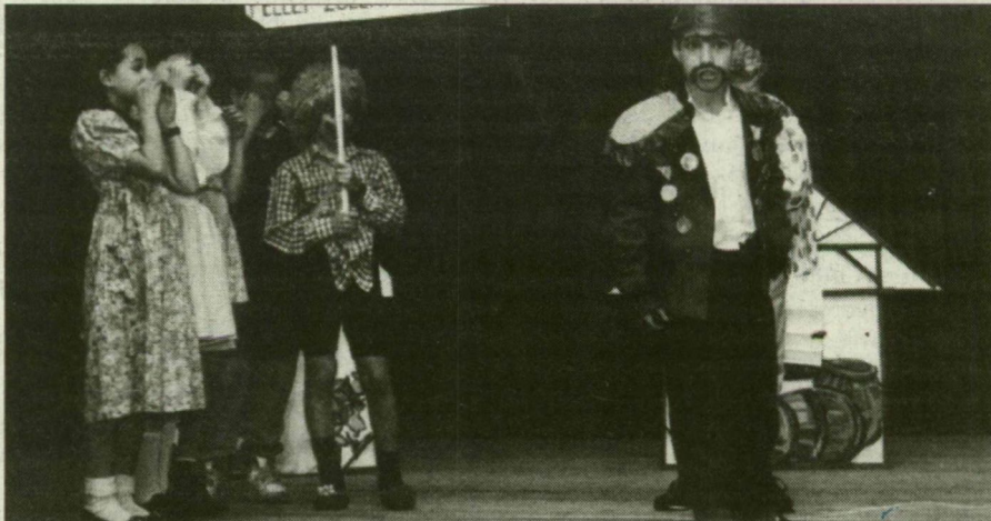
A Tarjánváros III. sz. Általános Iskola csoportja Pető Sándor: A két szomoróc című művét adta elő, Szentendrei Adrienn rendezésében.

Két teljes napon át tart – tegnap kezdődött, és ma végződik – az V. Weöres Sándor megyei gyermekszínházi találkozó Makón. Huszonhét produkcióval neveztek be iskolák a rendezvényre – többek között a mórahalmi Móra Ferenc, a kisteleki II. Rákóczi Ferenc, a szegedi Tarjánváros III. sz., és a rúzsai általános iskola egy-egy csoportja is részt vett, illetve vesz a találkozóon. A zsűri ma délután hirdeti eredményt; a legjobb csoportok területi, majd országos versenyre mennek tovább – ez utóbbit júniusban, Ajkán tartják meg.