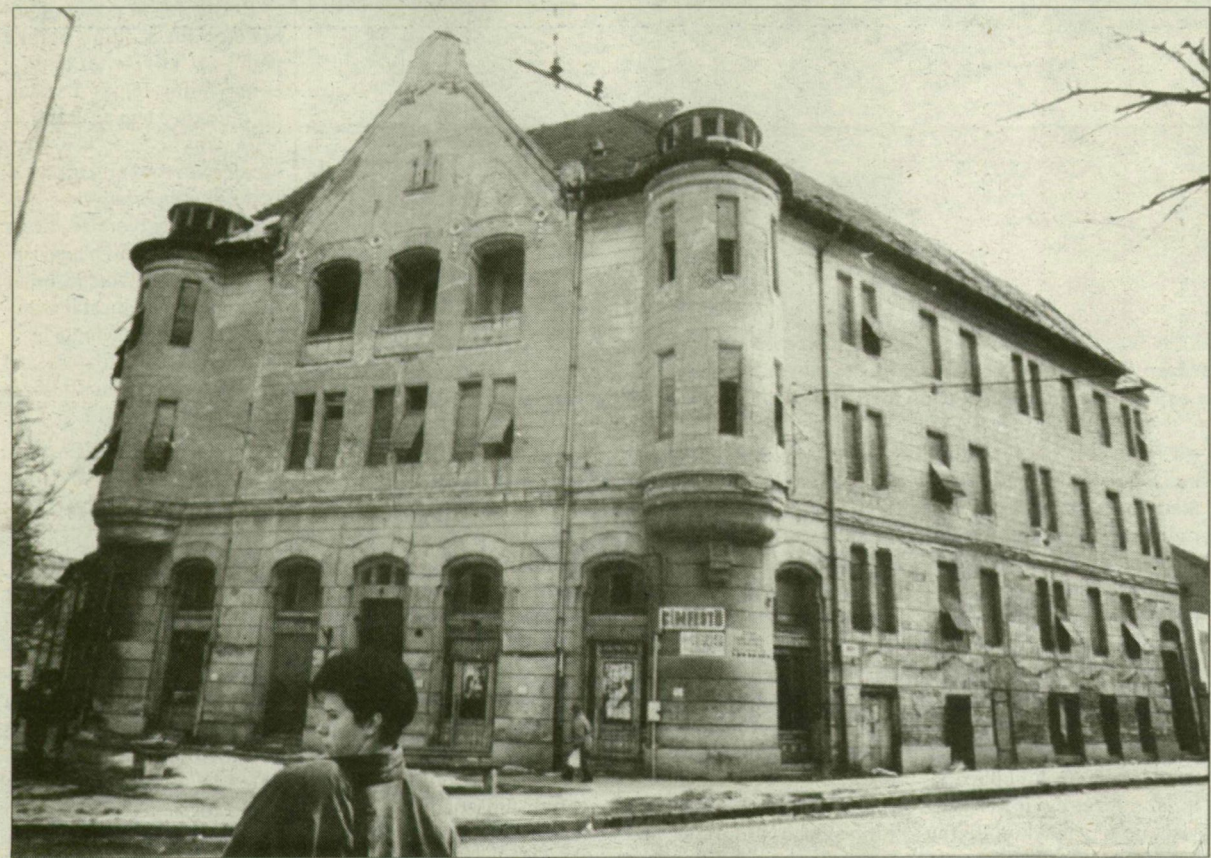
Egyelőre kísértetkastély.