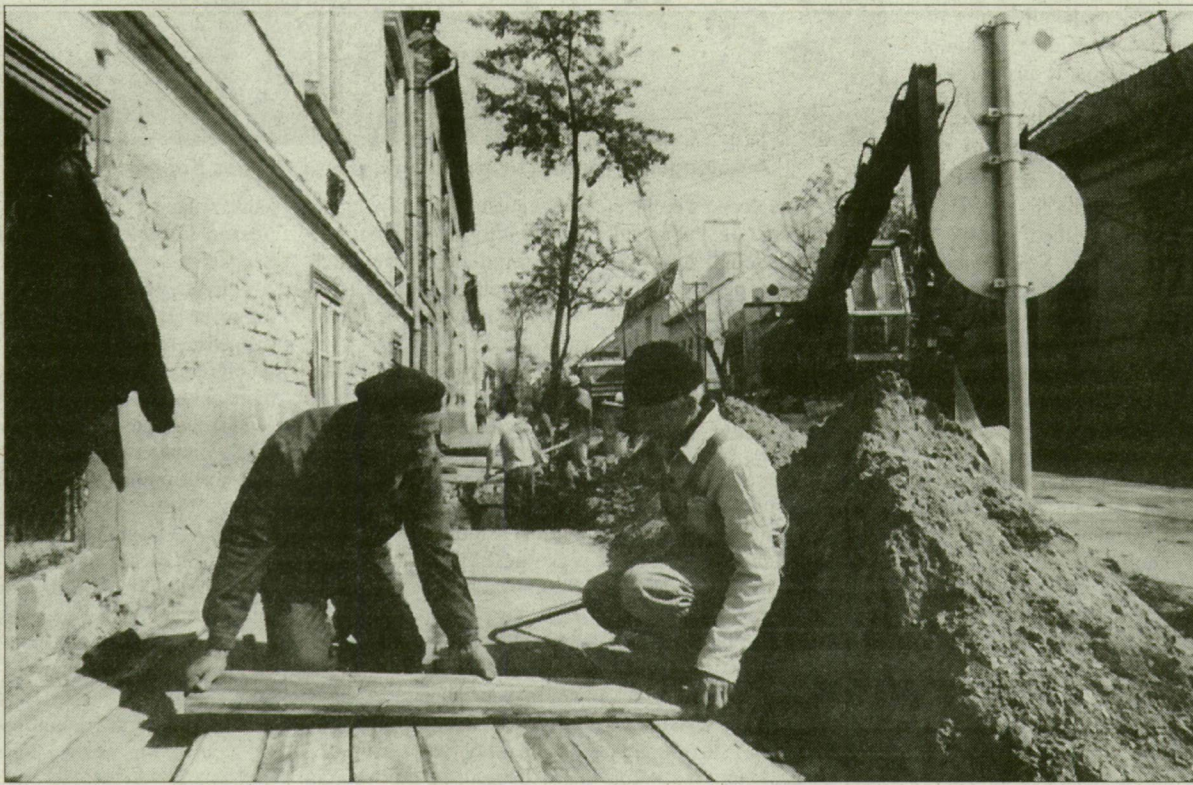
Telefonárok Öregrókuson. Kis munkát is elvállalnak.

A régi, nagy közúti építő vállalatok közül egyedül a HÓDÚT maradt „tisztán” magyar. Ez nem előny és nem hátrány – az utépítési pályázatok elbírálásánál a legfontosabb szempont a pénz. Vagyis az, ki milyen olcsón ígér. A HÓDÚT-nál tehát költséget faragnak, hasznot csökkentenek, üvegtermelékkel, kohóknél dúsítják az aszfaltot. Olyan aprómunkát vadásznak, mint a rókusi kábelfektetés, a Csillag téri átalakítás, azzal szeményelt, hogy lesz még utépítés az Alföldön.