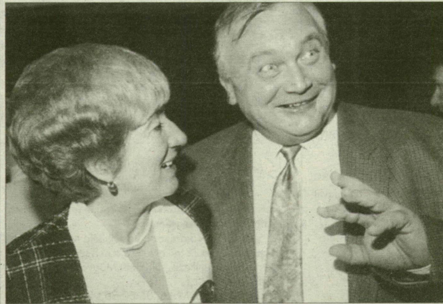
Pénteken Csintalan még nem tudta: mellette Kósáné – az utóda.