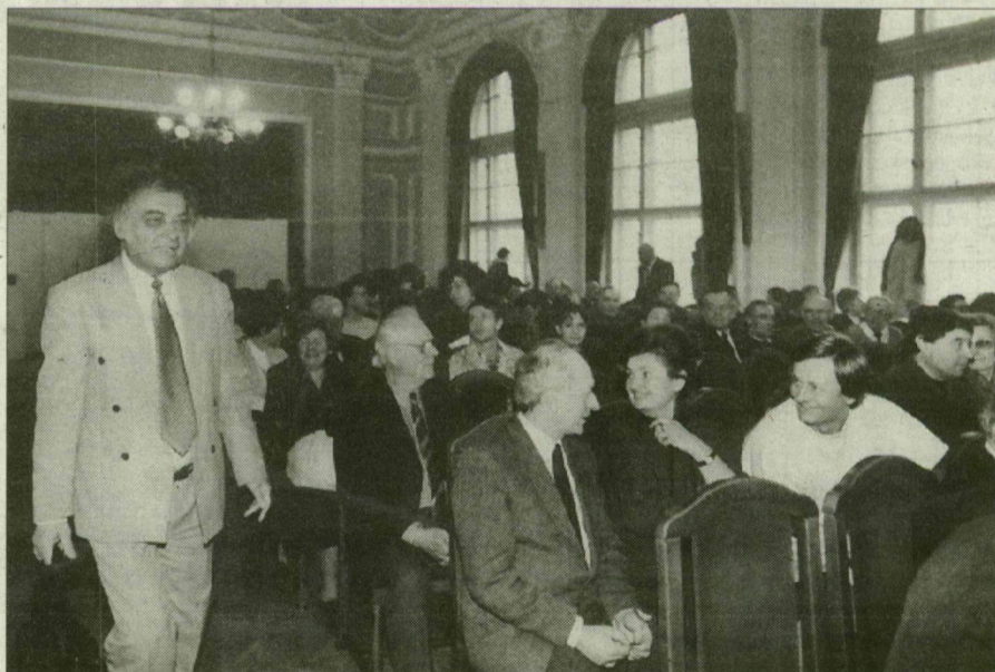
Az MVSZ városi és Universitas szervezetének tegnapi alakuló ülése a JATE aulájában.