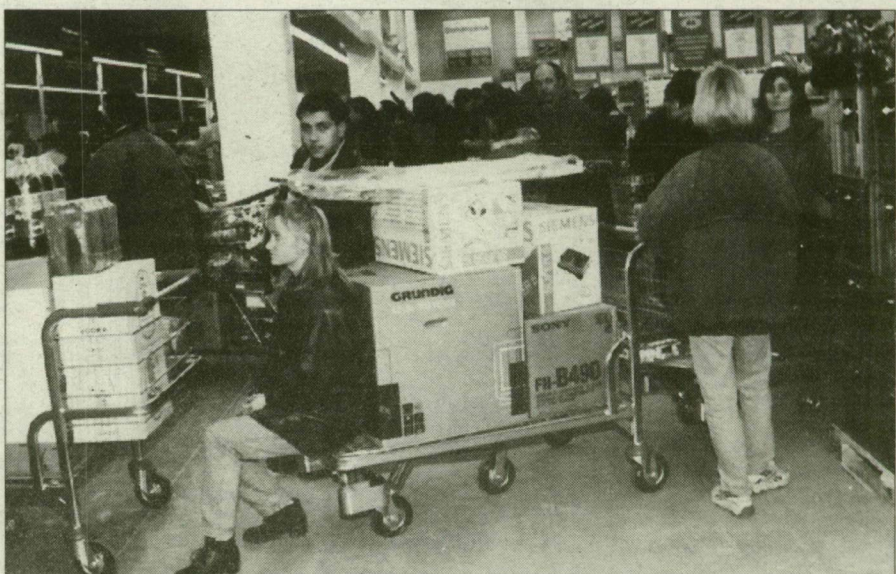
Türelem tévét terem.

„Mire megérkezett a kapitalizmus, elfogyott az emberek pénze” – mondta bölcse egy háziasszony ismerősöm, miközben a német óriáskonzern Szeged-szerte terjesztett prospektusait forgatta. Azt is hozzátette, ha lenne Metro-kártyája, sem menne ki az újonnan megnyílt bevásárlóközpontba, mert csak a szíve fájna. Ez a történet része a mai magyar valóságnak. Mint ahogy az is, hogy a nyitás óta eltelt négy napban a környék vállalkozó rétege és hozzátartozói a Metróban tolonganak és szákszámra költik a pénzüket.