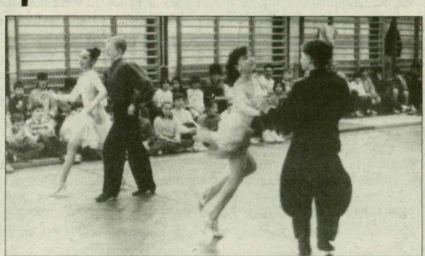
Az Alsóvárosi Általános Iskola tanulóinak táncbemutatója

Családi sportvetélkedőt és sportbált rendezett tegnap az Alsóvárosi Általános Iskola Alapítványának kuratóriuma és az iskolában működő diáksportegyesület. Az iskolaalaptvány, amelynek javára tavaly decemberben hangversenyt rendeztek a szegedi konzervatóriumban,