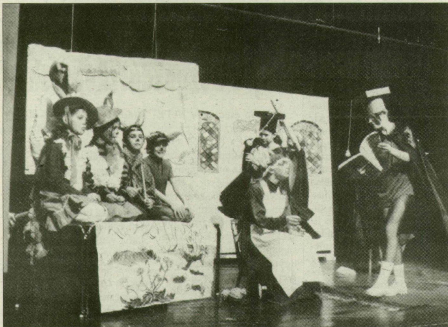
Egy vidám produkció.