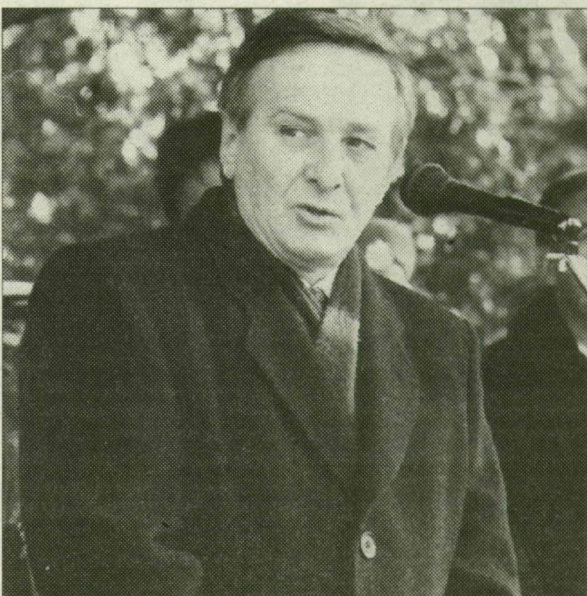
„A légiőrök kiemelten fontos.”

Keleti György honvédelmi miniszter nyilatkozik lapunknak