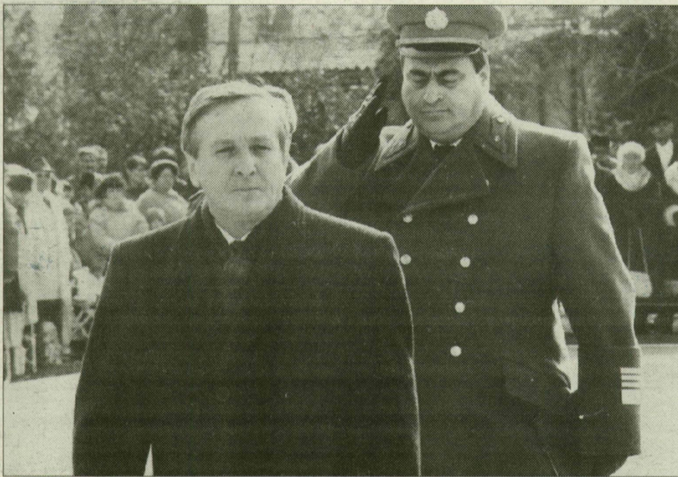
Keleti György a műszaki dandár újoncait is „végignézte”.

Az anyagtudományokkal, a nanorészecskével és a kolloidokkal foglalkozó kémikusok és fizikusok részvételével a NATO által támogatott tudományos konferencia kezdődött szombaton. A Szegedi Akadémiai Bizottság székházában Keleti György honvédelmi miniszter nyitotta meg a tanácskozást, s üdvözölte a világ minden részéből érkezett tudósokat dr. Szalay István polgármester is. A március 13-án záruló konferencia plenáris ülésein nemzetközi szaktekintélyek számolnak be kutatási eredményeikről, a Royal Szállóban pedig 54 posztert mutatnak be. A magyar tudományosságot két szegedi kémikus előadása képviseli: a konferencia magyar szervezője, dr. Dékány Imre egyetemi tanár (JATE Kolloidkémiai Tanszék), valamint dr. Solymosi Frigyes akadémikus (JATE, Szilárdtest- és Radiokémiai Tanszék) tart plenáris előadást.