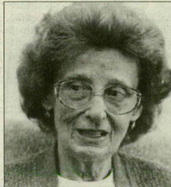
„...nem vagyok én a nagy felhajtáshoz szokva.”

– Meg ne kérdezem, hány gyerek fordult meg a kezem alatt, megbecsülni se tudom a számukat. – mondja a tőle megszokott fergeteges beszédtempóban. – Imádom a kis drágáimat, mind egyformán kedves a szívemnek. Tudod, engem apukám arra tanított, hogy senki sem tehet arról, hova született, csak arról, hogy milyen em-