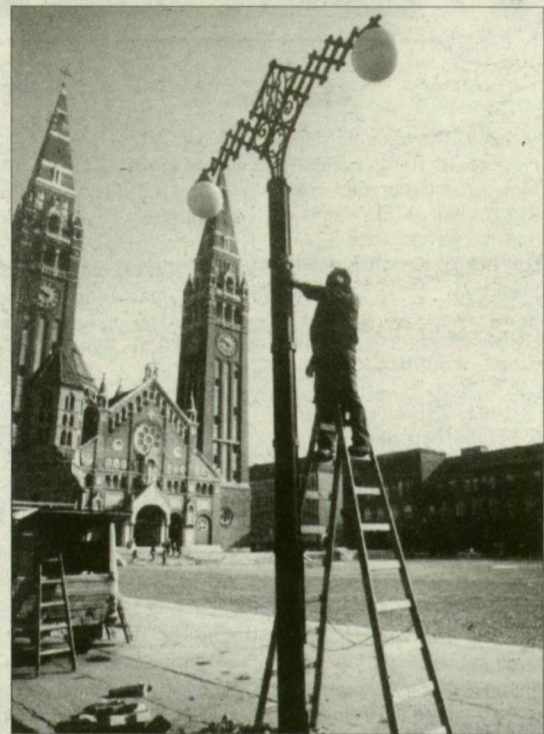
Az első fecske.