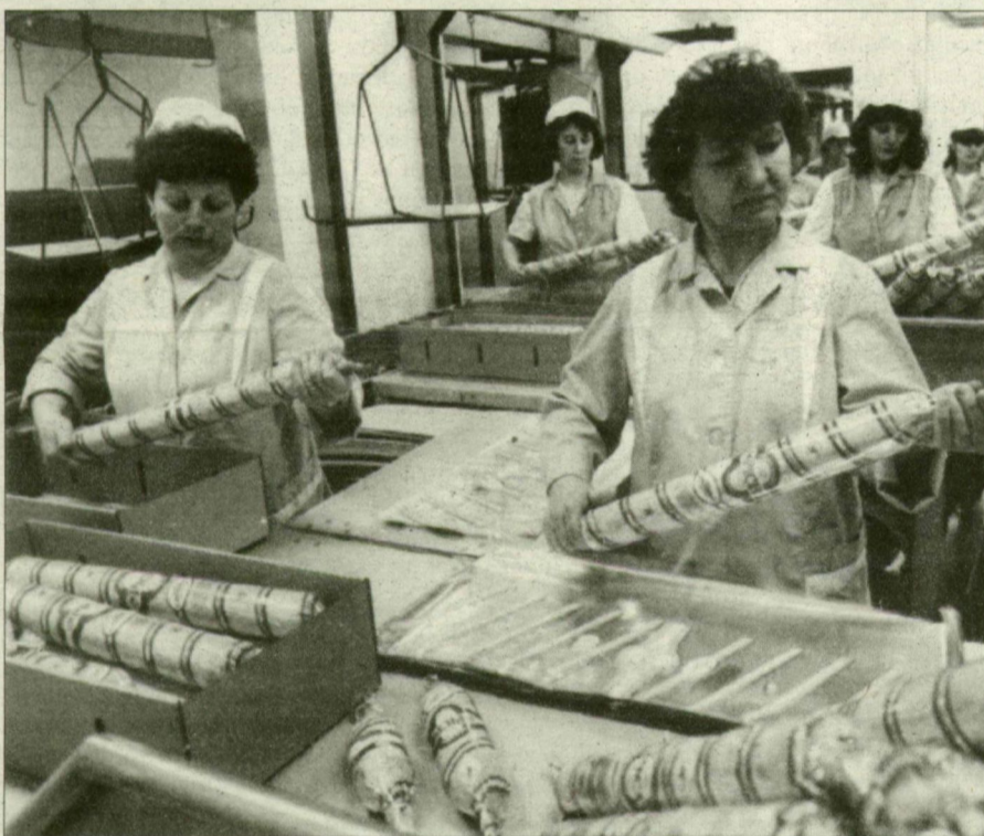
A minősített terméket csomagolni is csak fegyelmezett szabad.