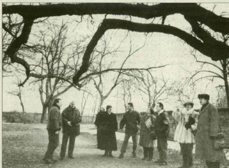
A szakemberek szerint a fák között is nagy az összevisszaság.

„Fagyos légkörben” (márciushoz képest igencsak hideg volt), de jó hangulatban találkoztak egymással tegnap délután, a Stefánián a polgármesteri hivatal, a környezetvédelmi bizottság, a városrendnokság és a meghívott szakemberek képviselői, hogy helyszíni szemlét tartassanak a sétány fái között. A liget állapota mindenki előtt közismert: a Stefánia már régiesen vár az alapos rekonstrukcióra.