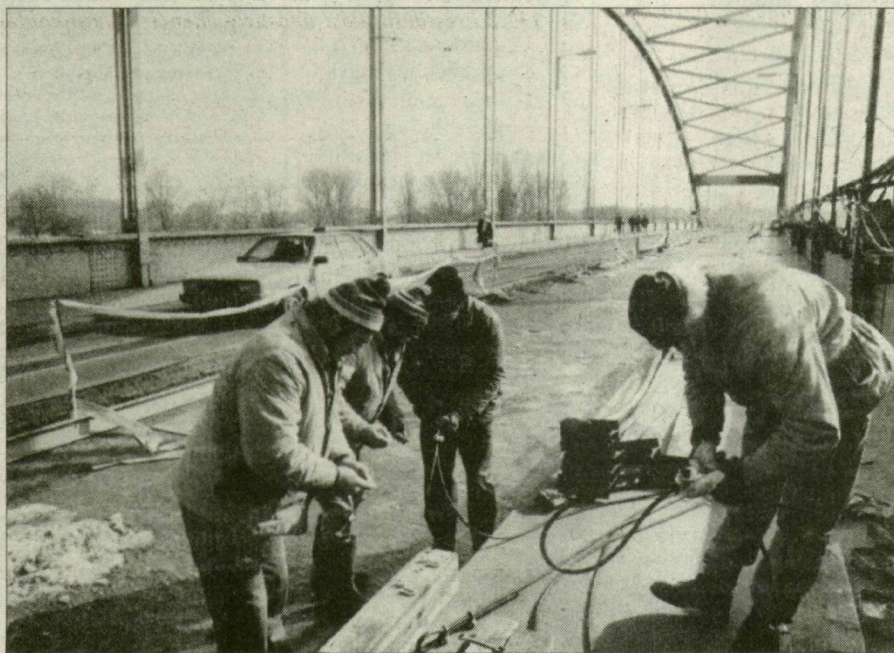
Szeged nagyberuházása, mindig szem előtt

A jelentősebb nemzetgazdasági ágak közül a mezőgazdaság és a feldolgozóipar géphányada jóval átlag fölötti (69, illetve 68 százalékos). Kimagaslóan magas ez az arány a pénzügyi szférában, ahol 11 százalékkal híján a