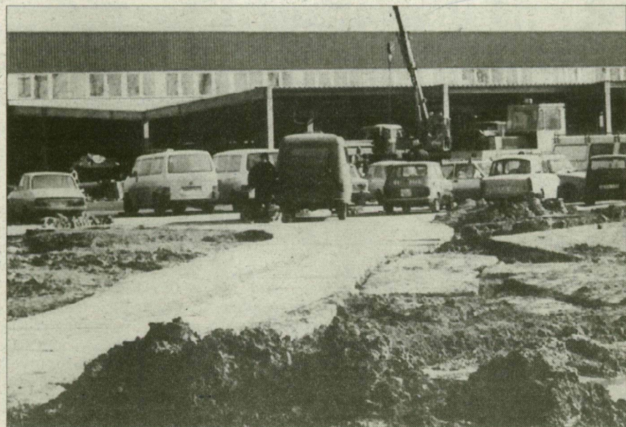
Szeged határában épül a Metro.

Csongrád megyében tavaly a korábbi 17 helyett csak 14 új beruházás indult, össz költségelőirányzatuk az 1994. évinek csupán egyharmadát éri el. A beruházásokból kettőnek a várható költsége meghaladja az egymilliárdot, a többsége 100-200 millió forint közötti. Az induló beruházások közül a Metro áruház építése, a szegedi belvárosi hídfelújítása, a nagylaki határátkelő és a hódmezővásárhelyi kórház bővítése, a megyei távközlési hálózat rekonstrukciója mint a leginkább közfigyelmet érdemlő fejlesztések emelhetők ki. Csongrádon átadtak egy időseket befogadó otthont, Szegeden tbszékházat, tanműhelyt, Szentesen kisegítő iskolát és nevelőotthont. (Írásunk az Egy százalék címoldalon.)