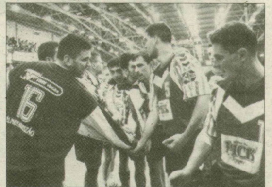
Pick-fogadalom: most, vagy soha!

A kézilabda NB I-ben, Szegeden Pick-Fotex csúcstalálkozó