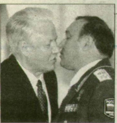
Védőrizet nélküli, bajtársi puszi. Jelcin és Gracsov.

(Részletek hétfői mellékletünk címlapján.)