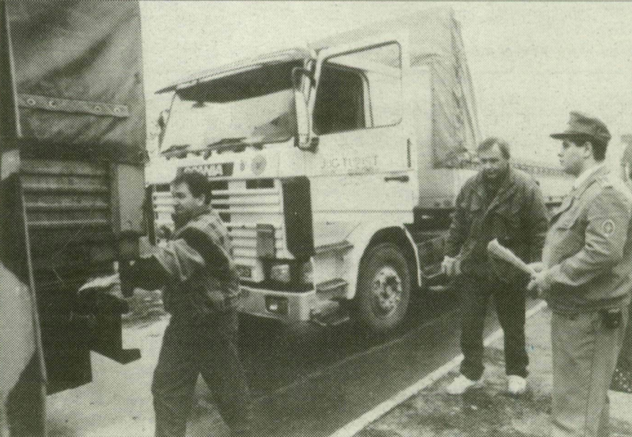
Kamionok a határon.

A Jugoszláviával szembeni ENSZ-embargó megszüntetését nagyon sokan várták, hiszen a kereskedelmi tilalom sokmillió dolláros kárt okozott a magyar cégeknek és polgároknak. Az embargót föloldották, azonban a helyzet most sem egyszerű. Tegnap jött ugyanis a hír, hogy adminisztrációs okokból kamionok százai kényyszerültek vesztéglésre a jugoszláv határon, a fuvarozatók klubjában pedig az üzleti kockázatokat elemezték.