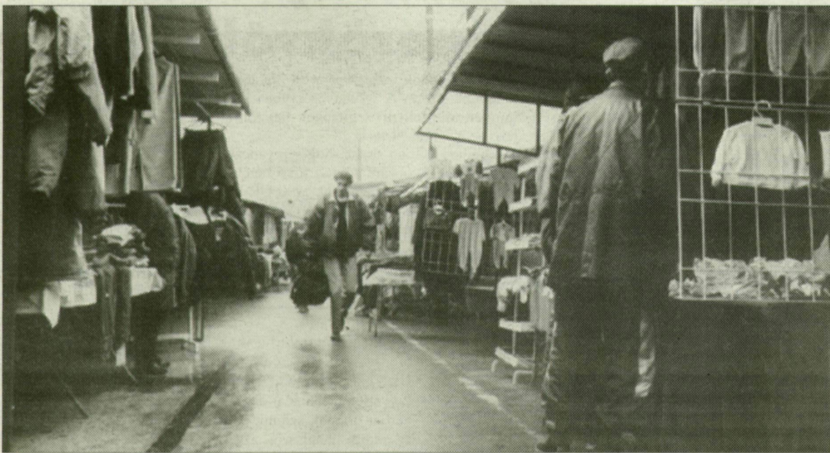
Ezentúl a tető alatti terület is „hasznos négyzetméter”.

Több mint száz kiskereskedő gyűlt össze tegnap, szerdán délután a Gábor Dénes Szakközépiskola egyik tantermében. Itt nyújtotta át nekik a Szegedi Vásár- és Piacszervező Kft. az új szerződéstervezetet, amely három hónapos egyeztető tárgyalás eredménye. A megállapodás tartalmazta a kompromisszumokat. Az ajánlat arról szól, hogy ezentúl a bódé- és kofasoron egy négyzetméterért 400 forint plusz áfát, vagyis 500 forintot kell fizetni. Az induló ár 2300-2900-ról ment egyre lejjebb, vagyis az érdeklődés jól dolgozott a kulisszák mögött.