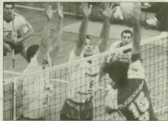
Itt jól működött a szegedi síncen.

Az elmúlt évek során, legyen az bajnoki, avagy kupameccs, mindig izgalmakban bővelkedő, nagy csatákat hozott a szegediek és a kaposváriak mérkőzése. Nem volt ez másként tegnap sem, amikor az újszegedi Sportcsarnokban az NB I. Extra-rájátszás keretében találkozott a két együttes. A somogy