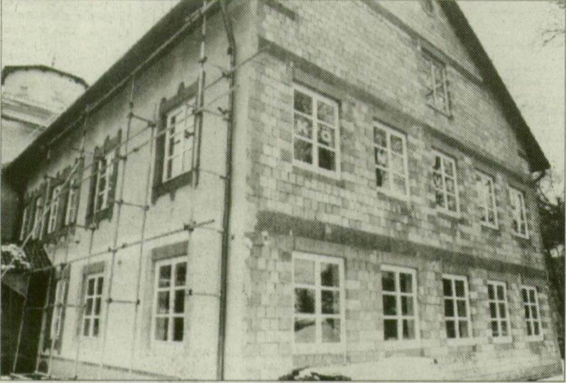
Könyvtár a Katolikus Közösségi Házban.