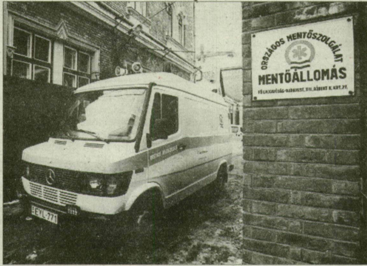
A jövő hét első napjától: telefonon és személyesen is a Kossuth L. sugárúton lesz a központ.

A szegedi mentőállomás épületében alakítják ki a város központi orvosi ügyeletét, ahol március elsejétől kezdődik ugyan az új rendszerű orvosi ügyelet, de a mentőállomás vezetői már most fontosnak tartják a szegediek tájékoztatását a megváltozó ügyeletről.