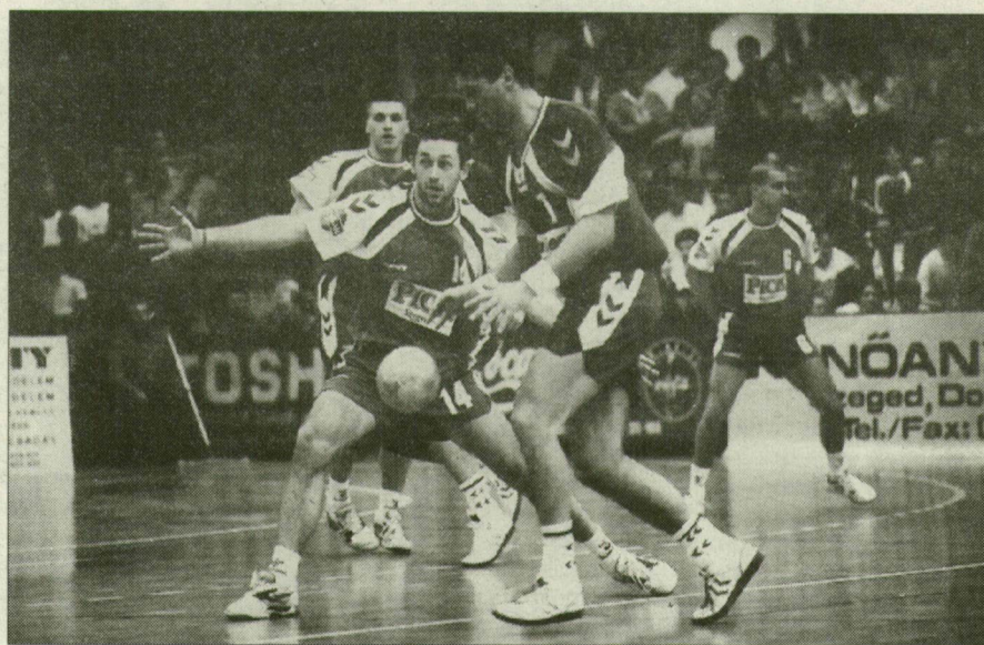
Mint ahogyan egy héttel ezelőtt a Hort SE, holnap bizonyára a Debrecen sem adja meg egykönnyen magát...

– Ezt nem állítanám. Egy csapat, amelyik a bajnokságban még egyetlen egyszer sem győzött, az mindent elkövet a sikerért. Ezt tette a Hort is. Nincsenek még annyira leszakadva az elő-