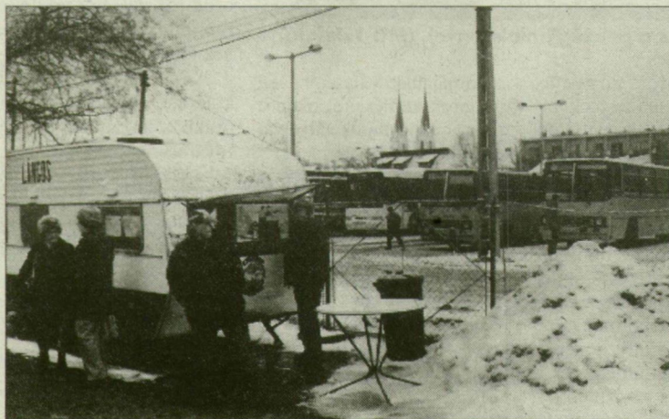
Mennek: a buszok és a vásár.