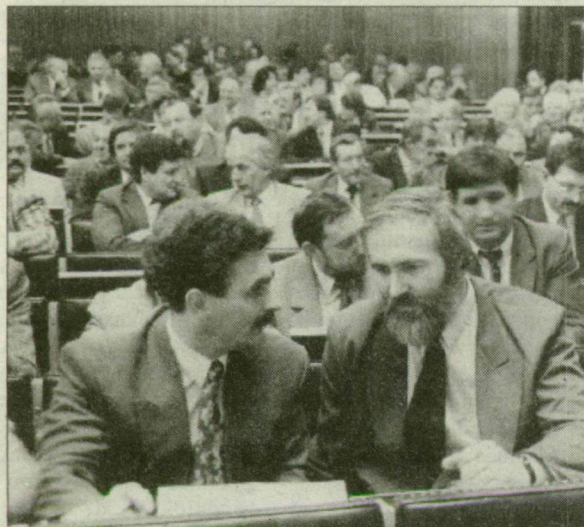
Polgármesterek egymás között. Résztulajdonosok.