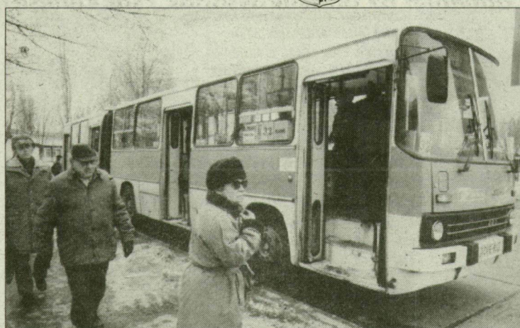
Átszervezés után: utasok furcsa hangulatban.