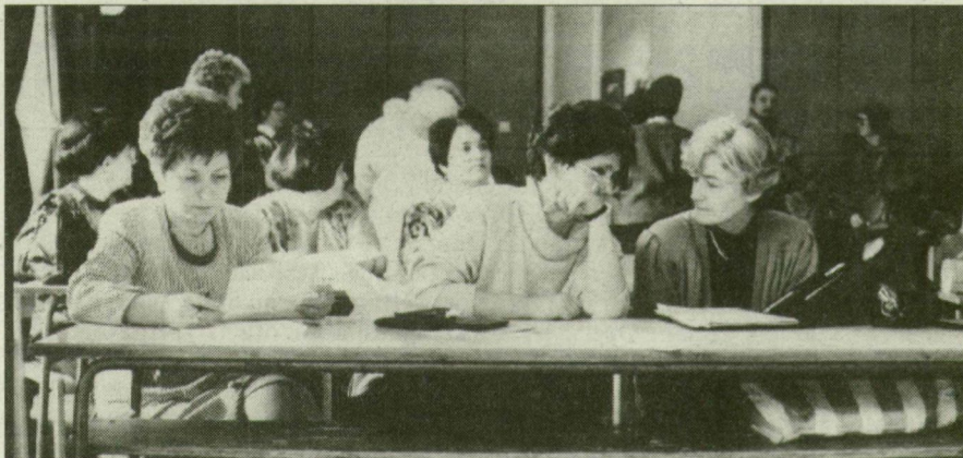
A pedagógusok szerint beiskolázás és érettségi előtt beláthatatlanok a következmények.

A fórumon Szemők Árpád bizottsági elnök megis-