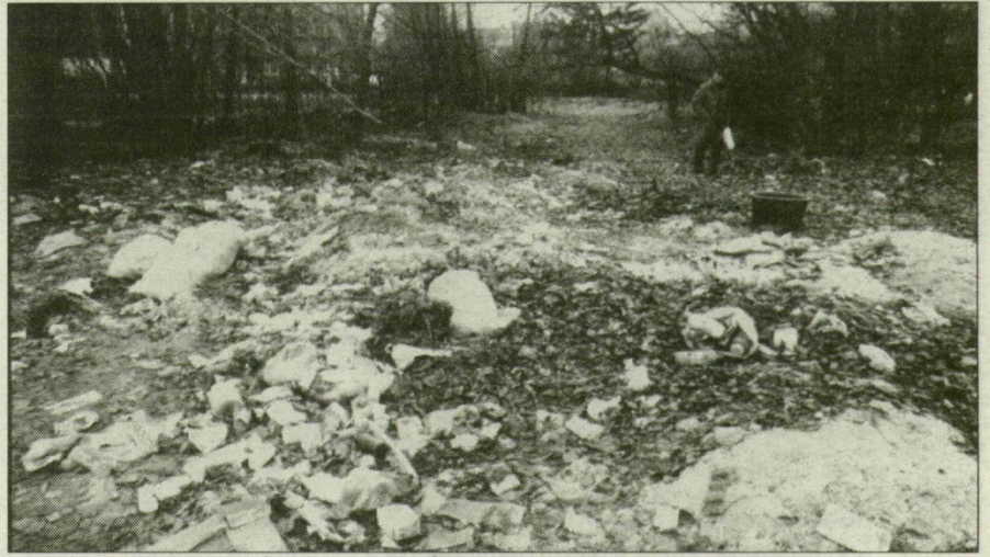
Újszegedi látkép.