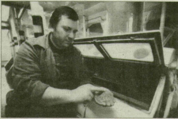
A szellemi erőket nem a paprikára koncentrálták.

● A Paprika Rt. két nagy „lábon” áll, az egyik a paprika, a másik a konzerv. Melyik területen véltetek alapvető hibát az előző években?