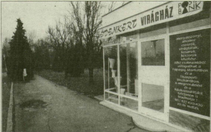
Talent Center: Édentől Keletre?...