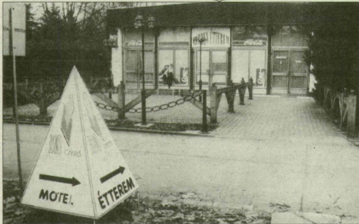
A Garden nem mindig ilyen csendes.