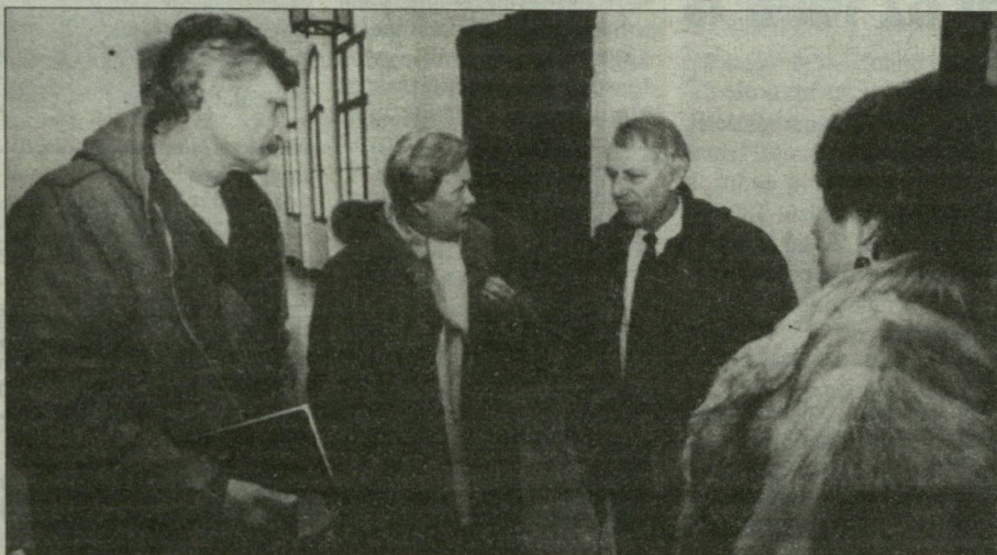
A csütörtöki bejelentés után a válságértekezletre érkező iskolaigazgatók közül sokan számolgotással töltötték az éjszakát.

A közoktatási intézmények vezetői sokkolva hallgatták végig tegnap Báthly Gábor alpolgármester előadását, melyben összefoglalta a városi oktatásra váró elvonásosomag elemeit. Az ülésen sem Szalay István polgármester, sem Szemők Árpád, az oktatási bizottság elnöke nem vett részt. Az alpolgármester – aki szerint a helyzet a parlamenti elfogadás után tragikus lett – a szigorú pénzügyi kényszerre utalva nyilvánvalóvá tette, hogy mostantól a város vezetése számára minden a működőképesség fenntartásának lesz alárendelve. Mindent összevetve 758 millió forintos hiányról van szó, melynek közel felét az oktatási és nevelési intézményeknek kell viselniük. Báthly Gábor szerint erre három lehetőségük lesz: