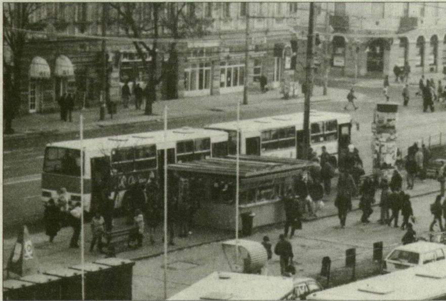
A Mars tér továbbra is zsúfolt marad...

A szegedi tömegközlekedés tervezett reformjáról – végigkísérve a döntéshozó folyamatot – már többször is írtunk. A tegnapi vita olyan járatok fölött zajlott, amelyeknek megváltoztatása igen érzékenyen érinteti az utazóközönseget. Az egyes lakókörzetek képviselői felszólalásaikban igyekeztek védeni választóik érdekeit.