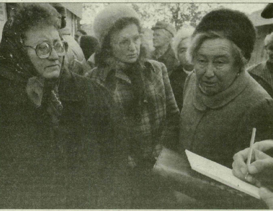
Teljes volt a felháborodás, zsongott a tér.

– Aki rabol, elviszik a Csillagba. Ez pedig nyílt rablás, csak éppen törvényesítették – kiabálta az egyik kistermelő reggel nyolc órakor a Mars téren. A többiek sem adták alább, mindenki hozzátette a magáét. Teljes volt a felháborodás, zsongott a tér, mint a méhkas. A Szegedi Nemzetközi Vásár- és Piacszervező Kft. ugyanis január elszejével új helypénzeket és bérleti díjakat állapított meg. A havi- és féléves bérleteket tegnap reggel 8 órától lehetett megváltani.