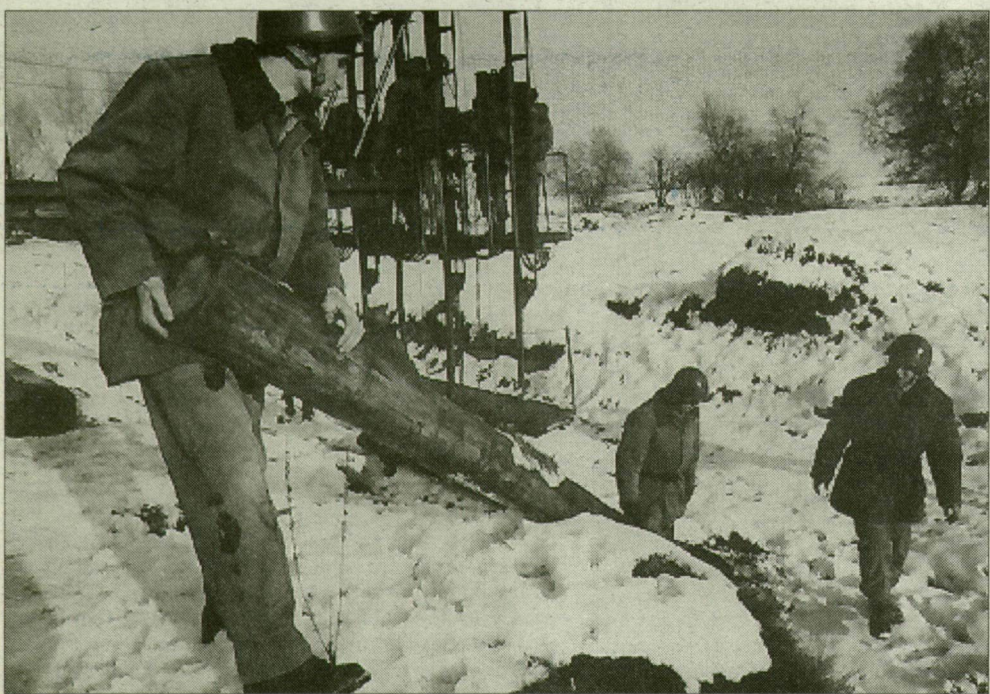
Egy hónap múlva már horvát területen, „élesben” dolgoznak majd a hídépítők.