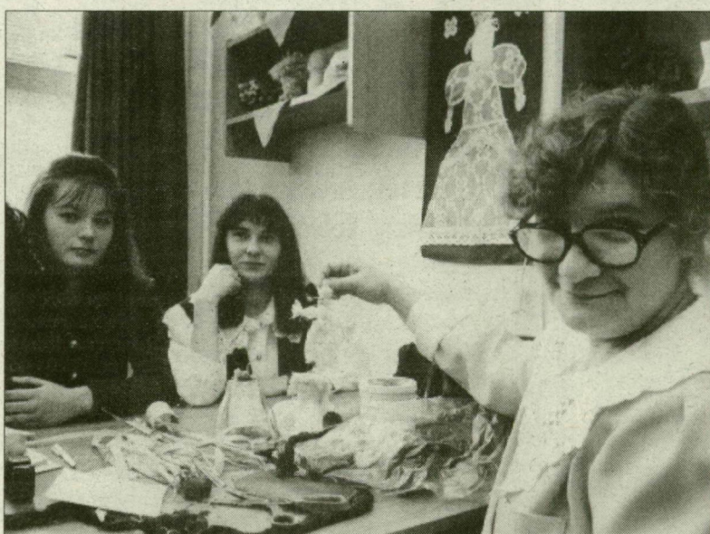
A szegedi csapat.

Az Országgyűlés zárószavazással elfogadta a vámjogról, a vámeljárás-jogról, valamint a vámigazgatásról szóló törvényjavaslatot, illetve előzőleg az egységes szövegtervezethez benyújtott alkotmányügyi bizottsági módosító indítványokat.