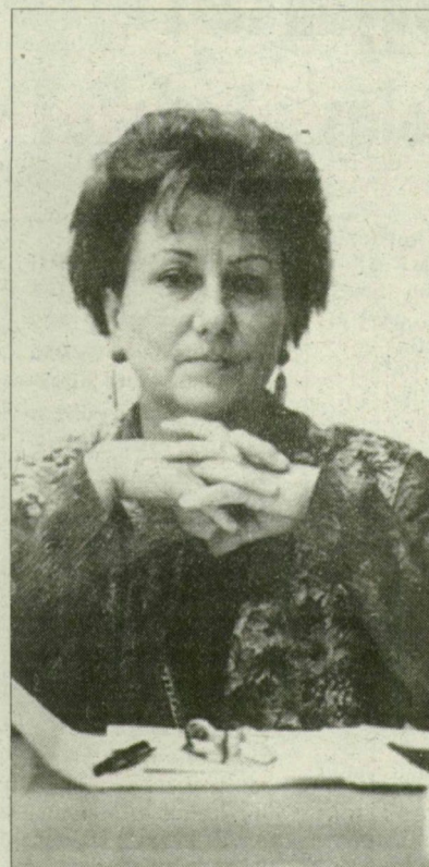
– Folytatjuk a dialógust.

Úgy érzem, hogy a külföldi résztvevők a három nap alatt részesei lettek egy magyar kultúra-élménynek is: európai színvonalú koncert a Szegedi Nemzeti Színházban; a Feszty-körkép lenyűgöző panorámája; a tápéi táncegyüttes folklórprogramja; szárnyashajó-utazás a Tiszán, és – Tihany. Mindennek köszönhetően a