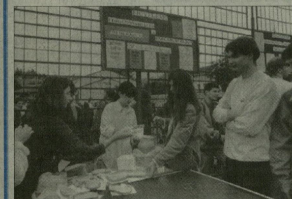
Menü a szegedi tüntetésen: zsíros kenyér teával.

díjrendeletéről. Néhány szónok véleménye szerint a hallgatóság csakis a polgári engedetlenségi mozgalom útján, azaz a tandíjfizetés tömeges megtagadásával tud majd eredményt elérni. (A nagygyűlésről szóló beszámolókat az 5. oldalon olvashatják.)