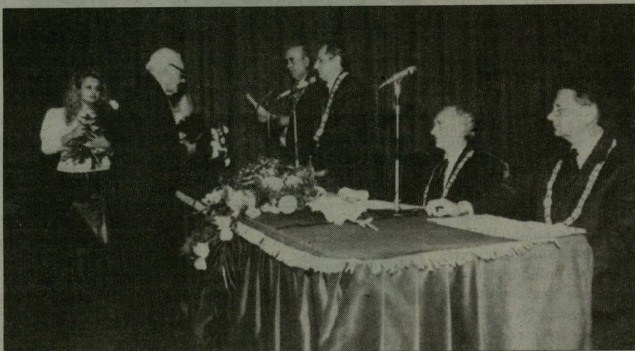
Az egyetem vezetői átadták a rubin, vas, gyémánt és arany diplomákat is.

remélni, hogy ez semmiféle elképzelésnek nem lehet célja, bármilyen rossz gazdasági helyzetnek nem lehet következménye. Ha mégis a realitás közelébe kerülne ilyenmi, kérek mindenkit, aki itt van, hogy minden lehetséges fórumon emelje fel a szavát. Ne engedjük, hogy ez a nemzetközi színvonalú nemzeti vagyon: a magasan kva-