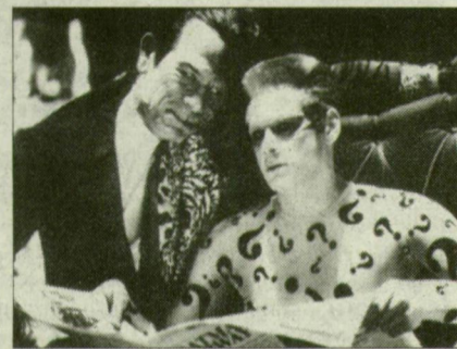
Kétarc és Rébusz

Nincs annál szívszorítóbb érzés, mint amikor rendes, tanult és talán még szakmailag is képzett emberek, ahelyett, hogy a kisujjukból kiszippantott frappáns ötletekkel megtöltenének egy sorozat harmadik részét, az első és második rész elemeit össze- és szétvariálva korbácsütésként pattintják a nézők szemébe, akik ettől aztán nem látnak többet.