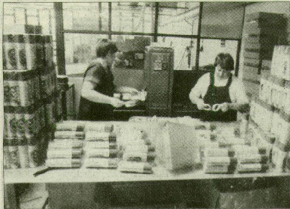
Sikerese cégnél munka is van.