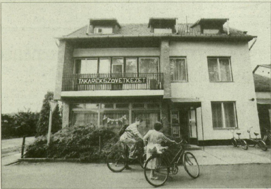
Üllés. Legtöbbször biciklivel hozzák vagy viszik a pénzt.

Az elmúlt öt évben persze változott a falusi élet is. Ülésen, Szatymazon, vagy éppen Mórahalmon úgy vándorol ki vagy be a pénz a takarékból, ahogyan a mezőgaz-