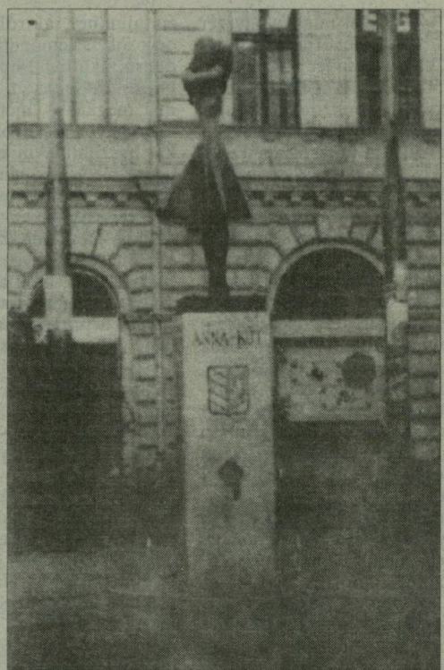
A szege di Anna-kút