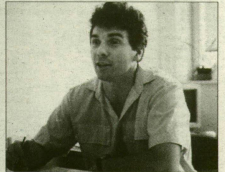
Manapság első a munka és a család.

– Tízennégy éves koromban, szülőhelyemen, Nagymaroson kezdtem el kajakozni, és azzal a lendülettel felvételiztem a középiskolába, a váci Sztáron Sándor Gimnáziumba, fizika tagozatra. Ez azért is fontos, mert azóta a fizikához az égvilágon semmi közöm. Valahol az igazán komoly kajakozás és a gimnázium köztudik egymáshoz. A 25-30 kilométerre lévő Vácra jártam gimibe, vonatoztam mindennap oda-vissza, a kajakozást viszont Nagymaroson folytattam. A második évben már magyar bajnok lettem, utána szép lassan válogatot. Az iskolában egyébként nem igazán tudták, hogy sportolok, csak valamikor harmadikban derült ez ki, amikor valamilyen nagy nemzetközi ifjúsági versenyről jöttünk haza, és az újságok is írtak róla. A tanárok zöme tényleg nem tudta, hogy kajakozom, de attól kezdve egy kicsit más volt a megítélés, egy kicsit kellemesebben álltak hozzám, egy kis sé engedékenyebbek lettek. Megértették, miért nem tanulok teljes lendülettel.