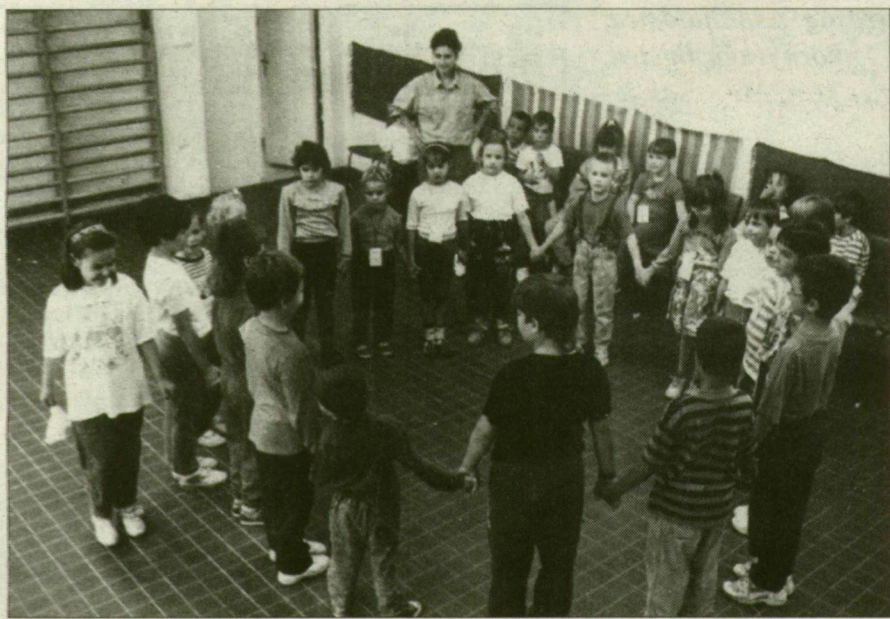
A kicsik is edzésben vannak.