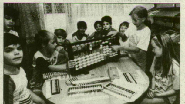
Megy ez, mint a japánoknak.

Ma már nálunk is néhány iskolában szorobánra egészítik ki a matematikaoktatást, és az Odessai Könyvtárhoz ha-