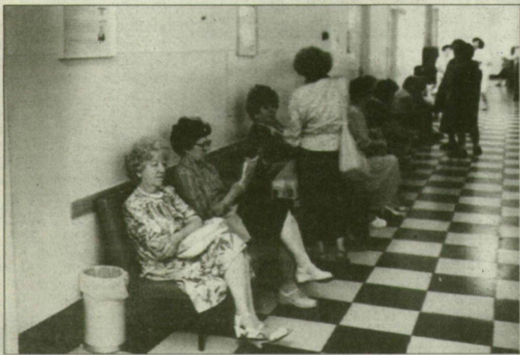
Rendelőintézeti fogászat. A fájdalmasabb beavatkozás még csak ezután következik.