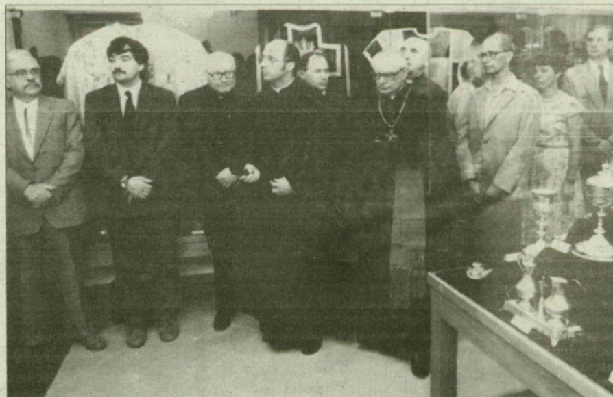
Kincsek és vendégek a múzeumban.