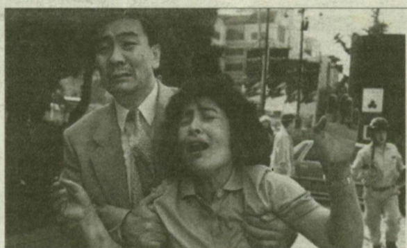
A túlélők egyike.

Lengyelországban július elsejétől emelik a háztartási energiafelhasználás fogyasztói árát. A földgázért és az elektromos áramért a lakosság számára a jövőben 6,5, illetve 8 százalékkal kell majd többet fizetnie. A varsói pénzügyminisztérium közleménye rámutat, hogy az intézkedéssel folytatni kívánják az energiahordozók árának 1989-ben megkezdett piacosítását. A folyamat célja, hogy a költségvetésre jelenleg súlyos terhet róvó energiaszolgáltató vállalatok önfinanszírozóvá váljanak. Az áremelés a lakosság mellett a nagyfogyasztókat is érinti, számukra július első napján átlagosan 7 százalékos emelés lép életbe.