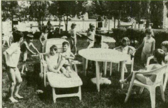
Kisiskolásoktól a nyugdíjasokig sok vendég megfordul itt.