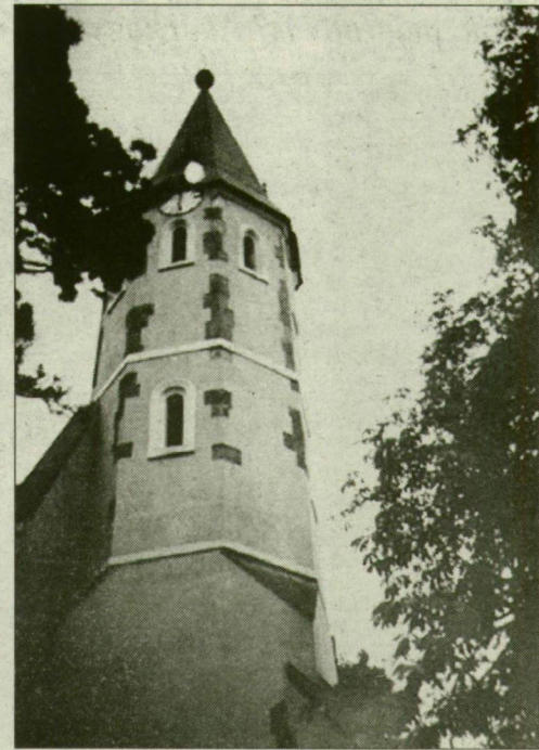
A nagyszöllősi templom

fogadalmas szerzetes él a kolostorban, és harminchat fiatal fogadalmas szerzetes. László atya vallja, hogy a hithez több bizonytalanság, több kételkedés kell, ezért sorra meg kell szabadulni az illúzióktól. Életét ennek a két mondatnak a fényében vezeti: „Neked oda kell menned, ahova nem akarsz. Ott a helyed, ahol nehéz lesz.”