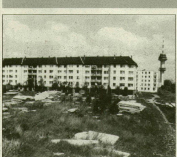
A sanyarú sorsú Francia-högy.

mazta, mielőbb döntsék, mert szörnyű, mekkora gaz van a területen. Erre Szilvási László felhívta figyelmét: eddig öt éve volt rá, hogy képviselői alijából felfogadjon egy kaszás embert.