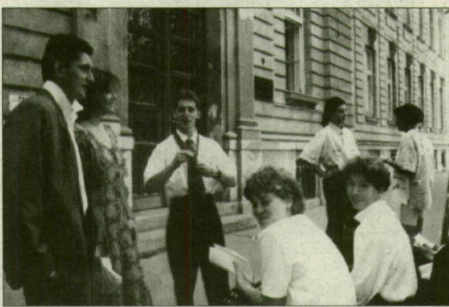
A vizsga után a diákok már vidámak. És a vizsgáztatók?

– Ilyesmit jelent a „mintegy”, meg azt, hogy a pénzügyi diktátoroknak ez mindegy. Ránk bízzák. Úgy tetszik, teljességgel közömbös számukra, hogy mindkét eset katasztrófát jelent. A legnagyobb csapást az Európához való érdemi csatlakozásunkra, Magyarországon jövőre. Ha mindez megtörténik, a mai fiatalok, az egyetemisták ala-