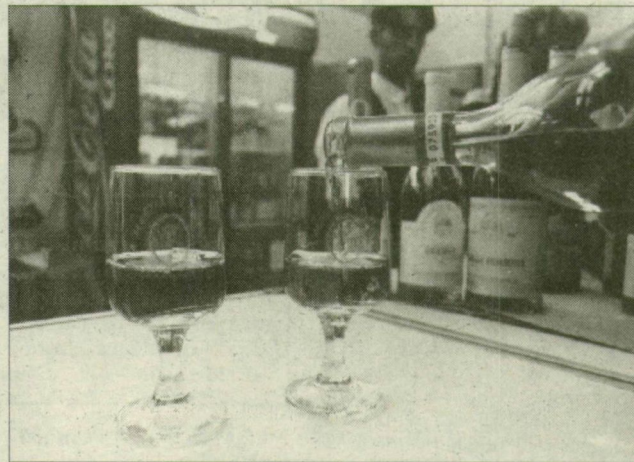
Nem csak időtöltés.

A vásárhelyi, sóshalmi pin-cészet kiállításánál frontot tartó úr váltig mondogatta, ne kérdezzem, mert ő korábban a szövetségben az állatnyész-tésben dolgozott, csak azóta nyergelt át, amióta a takarmánytermelő terület „elpárol-gott” a telep mellől. A látoga-tókkal lefolytatott diskurzus