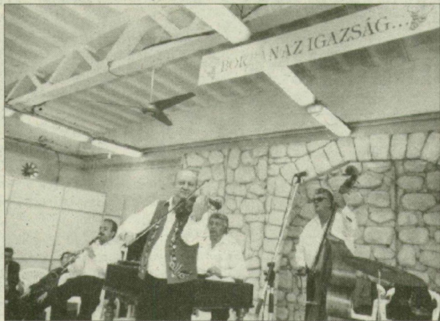
A zenei aláfestést a bortörvény sem tiltja

személy (férfit egyértelműen nem írhatunk, ugyanis 14, 17 és 37 éves polgárokról van szó) csak a szemérem elleni erőszak bűnébe esett vele szemben, ugyanis „megelégedtek” a gyengédnek egyáltalán nem nevezhető simogatással; a negyedik, 19 éves fiú viszont megerősöskölte a lányt. Az ügyet a rendőrség vizsgálja.