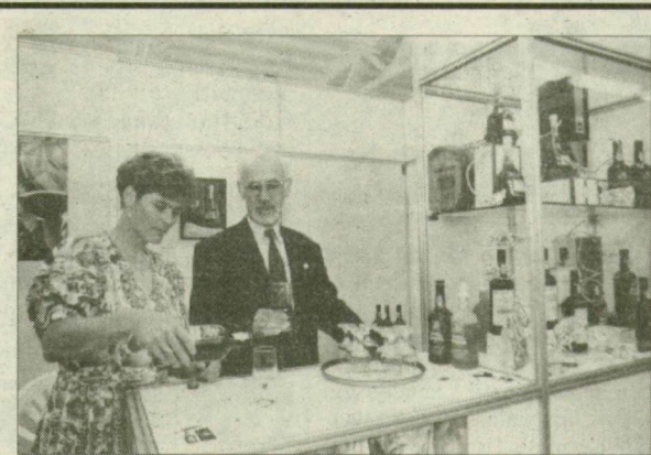
„Portós” üdvözlét.