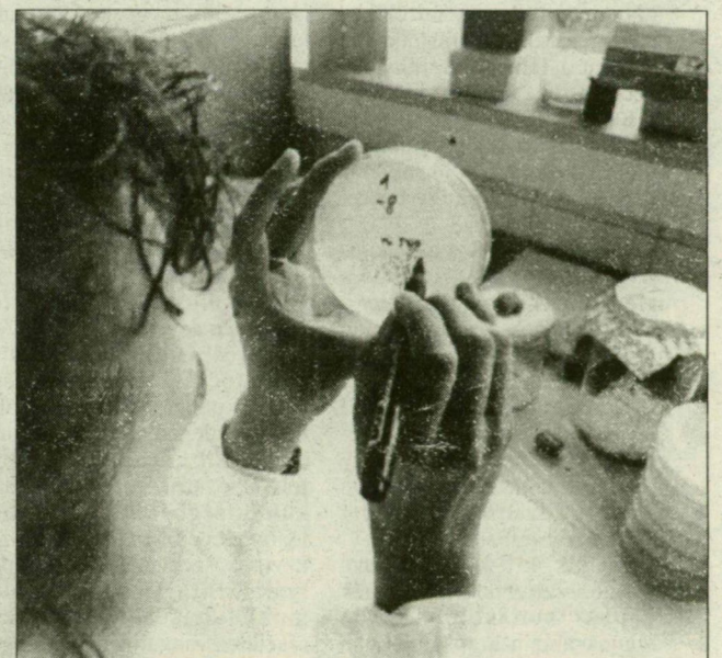
A biotechnológia „műhelycsarnokában”