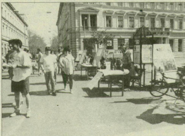
A Klauzál téren mégsem szónokoltak

■ Vártuk, utóvégre mi is beharangoztuk az eseményt. De nem lőn, legalábbis nem olyan formában, ahogyan azt vártuk. A Föld napján ugyanis a város illetékes intézményei, egyesületei igazán kitettek magukért, nagyszzerű programokat szerveztek, rengeteg helyszínnel, sok résztvevővel, színes, érdekes látványossággal. A „park” azonban nem jött össze.