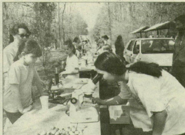
A vadsparkban több volt az érdeklődő.

Érdekes programok vártak délután a szegediekre a vadas-